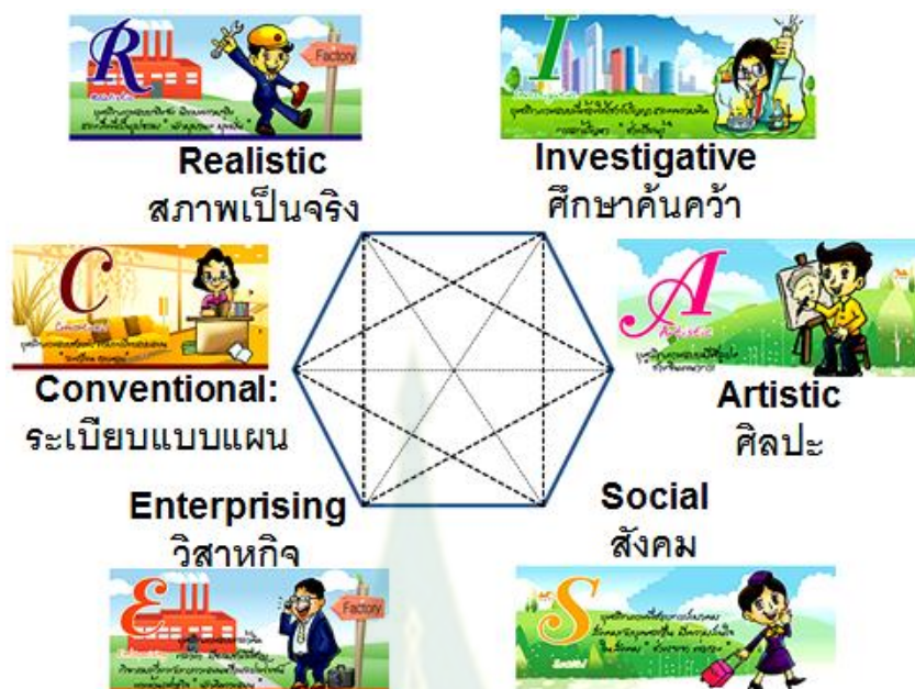
ภาพที่ 2.2 โครงสร้างภาพหกเหลี่ยมลักษณะอาชีพของฮอลแลนด์ ที่สอดคล้องกับลักษณะ ของบุคคล 6 ประเภท

ที่มา : ปรับจาก Holland, 1997 cited in Creager and Deaco, 2012, p. 48